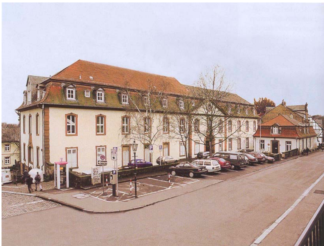
Abb.2: Die Universitätsreithalle von 1731/32 (heute: Institut für Sportwissenschaft, vormals Institut für Leibesübungen / IfL, Barfüßerstr. 1)

„An Stelle der Barfüßer-Kirche wird eine Reithalle gebaut (mit dem F. R. = Fridericus Rex im Medaillon an der O-Seite). (1731/32).“ (W. Kessler 1984, 58)