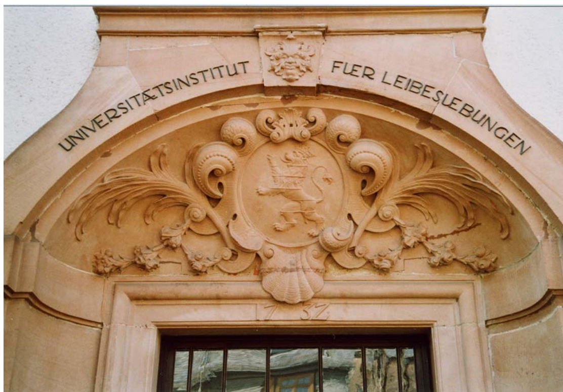
Abb. 4: Nord-Portal des IfL mit hessischem Wappen und der Jahreszahl 1732

„Ausbau des Deutschordensgutes zu einem Universitäts-Reitinstitut: Fortsetzung und Vollendung der Bauarbeiten, wie Ausbau des früheren Wirtschaftsgebäudes zu Wohnungen für den Universitäts-Reitlehrer und einen Futtermeister, Herrichtung von Umkleideräumen pp., einschl. einer neuen Heizungsanlage, Ausbau der Pferdeställe, Ausbau der alten Scheune zu einer geschlossenen Reitbahn, Herstellung der Einfriedung, Außere Instandsetzung der Gebäude.“ (Chronik 1926, 5)