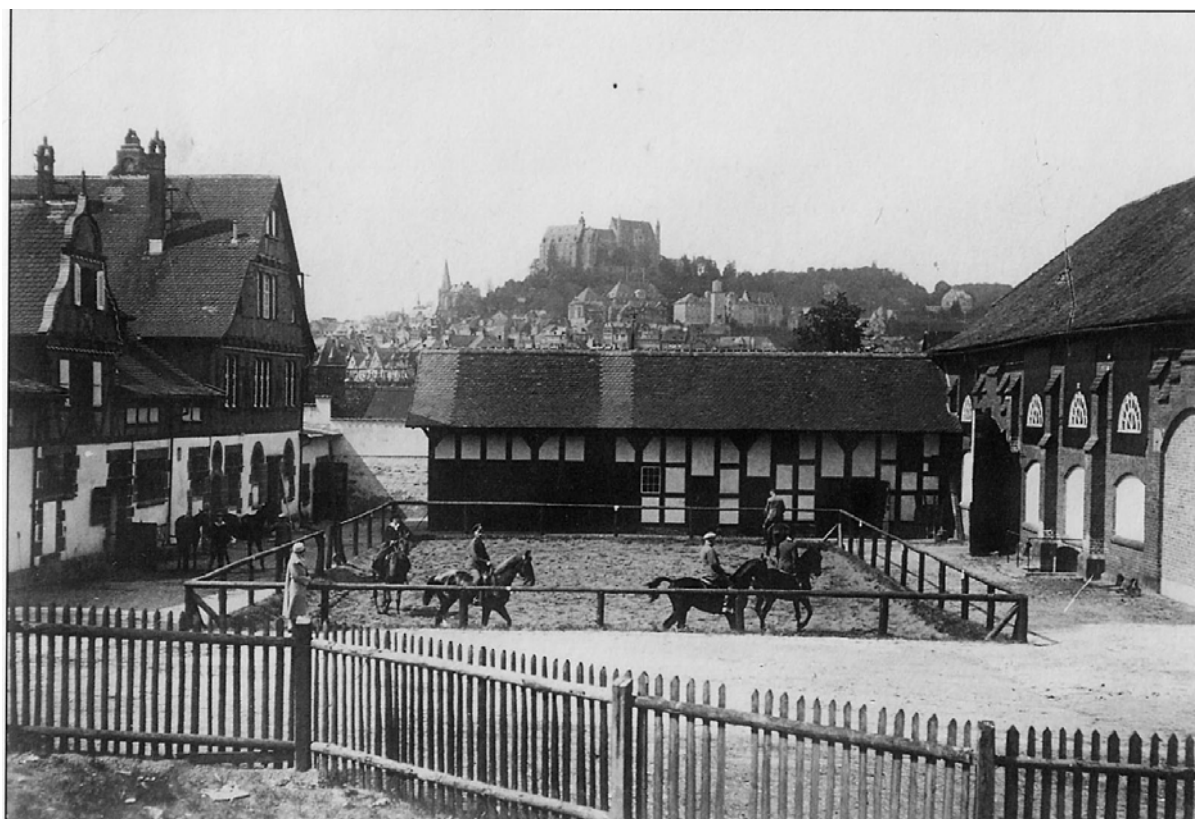
Abb. 6: Universitätsreitinstitut am Ortenberg, um 1930

1925: „Schon 1925 war versucht worden, den seit 1914 ruhenden akademischen Reitsport neu zu beleben. Die alte Reithalle in der Haspelstraße wurde wieder betriebfähig hergestellt, aber die Räume waren zu eng und trostlos. Da gelang 1926 ein großer Wurf. Die Universität übernahm das ehemalige Deutschordensgut am Ortenberg. Die selten günstig gestalteten Bauanlagen wurden in vorbildlicher Weise zum Universitätsreitinstitut umgebaut. Eine große gedeckte Reitbahn von 550 qm, eine offene Reitbahn, Sprunggarten, schmucke Stallungen für 25 Pferde und eine weite Koppel tragen dazu bei, daß das neue Marburger Reitinstitut weit über die Provinzgrenzen hinaus einzigartig dasteht.“ (P. Jaeck 1927, 8)